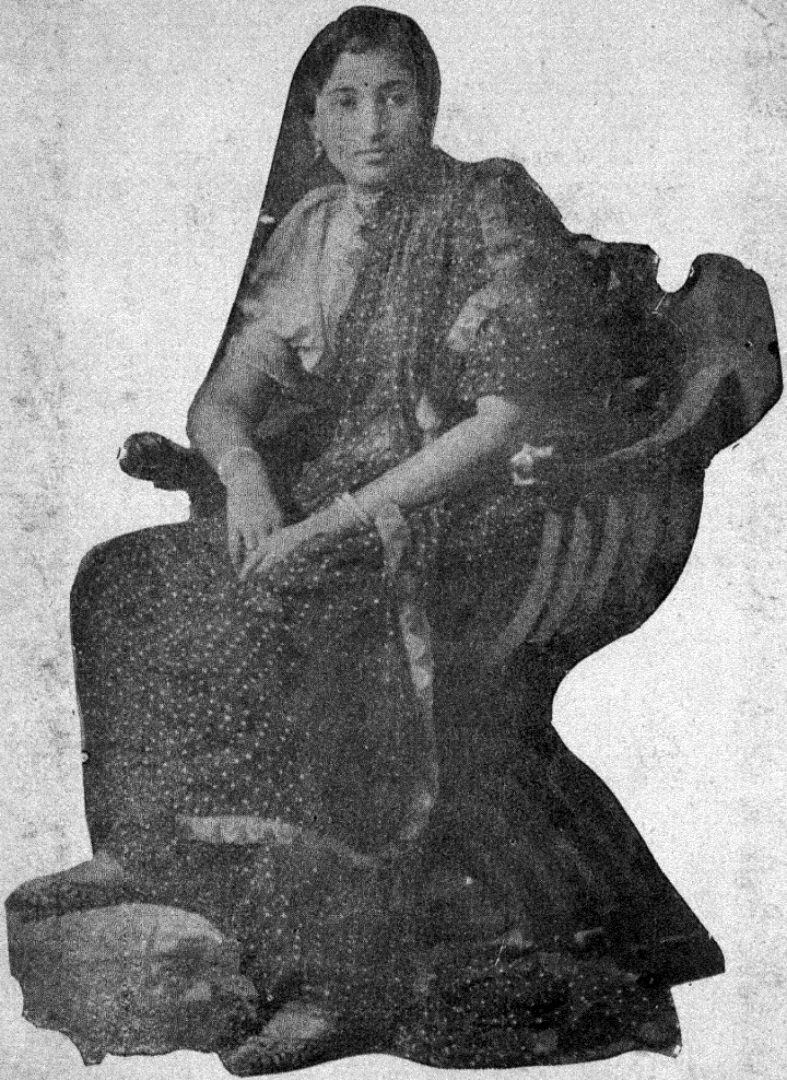
श्रीमंत स० सौ० भागीरथीबाई डफले राणीसाहेन संस्थान जत